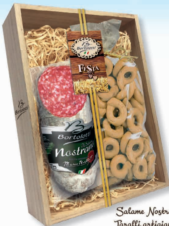
Salame Nostrano 350g Tartalli artigianali 200g

Con Bortolotti il salame si trasforma per aggiungere valore alla categoria accompagnandosi a prodotti affini che stuzzicano l'appetito e danno forma a golose e innovative confezioni. Le nuove wood boxes Bortolotti sono belle, buone e convenienti: sono l'idea regalo ideale! Genuinità ed eleganza. Festa, tradizione, collezione. In una parola: Bortolotti.