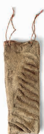
PANCETTA PEPE NERO