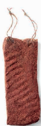
PANCETTA PEPE ROSA

I NOSTRI PRODOTTI SONO L'ECCELLENZA ARTIGIANALE DELLA TRADIZIONE CULINARIA ITALIANA E RISPONDONO AI PIÙ ELEVATI STANDARD QUALITATIVI: NASCONO DA UN'ATTENTA SELEZIONE DEI MIGLIORI SUINI DI CUI GARANTIAMO IN OGNI MOMENTO LA TRACCIABILITÀ UNITA AD UN'INSTANCABILE RICERCA DELLA FORMA PERFETTA, CHE LI RENDA UNICI NELLA PRESENTAZIONE. IL PROFUMO AVVOLGENTE CHE SI SPRIGIONA DALLA PRIMA ALL'ULTIMA FETTA SARÀ CAPACE DI VALORIZZARE OGNI ABBINAMENTO, ANCHE QUELLO PIÙ INASPETTATO.