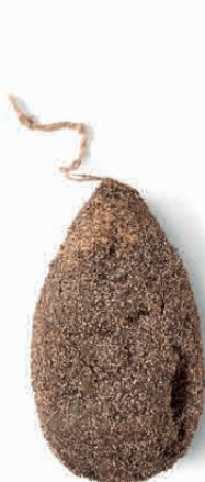
GUANCIALE PEPE NERO