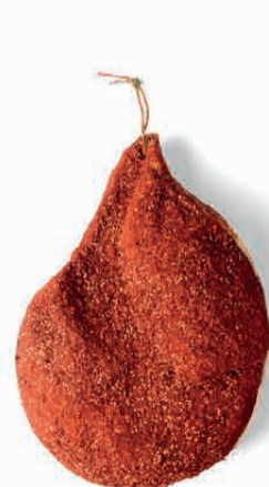
SGAMBATO NAZIONALE PEPERONCINO