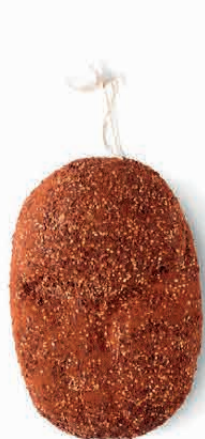
FIOR DI FESA NAZIONALE PEPERONCINO