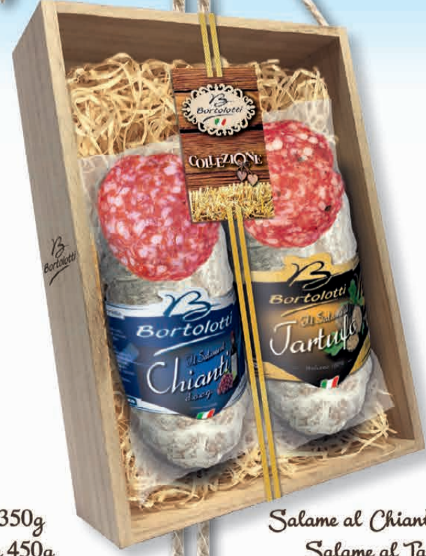
Salame al Chianti d.o.c.g. 350g Salame al Tartufo 350g