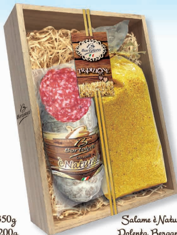
Salame è Naturale 350g Polenta Bergamasca 450g